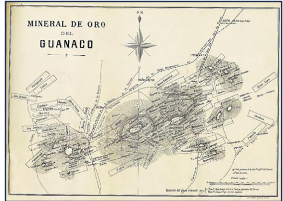
Minas en el Mineral de El Guanaco, 1885.